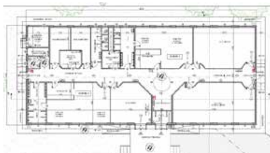
Planimetria dell'immobile che ospiterà le due classi di materna