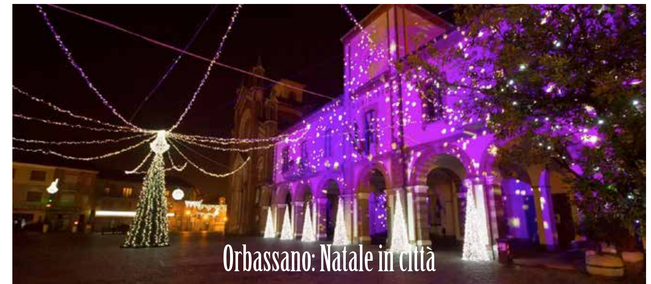
Orbassano: Natale in città