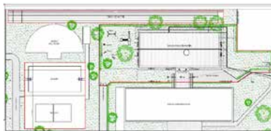
Planimetria generale dell'intervento, deliberato nella giunta dell' 11 luglio 2016.

20 anni. Tale indicazione venne deliberata il 13 di ottobre 2016 da parte della giunta comunale. Il 7 luglio 2017, tramite una lettera al Dirigente dell'area Patrimonio della Città Metropolitana si richiede la dismissione anticipata del locale per poter già iniziare i lavori di adeguamento sopra elencati, in attesa della deliberazione da parte della città metropolitana. L'ultimo passaggio di questo lungo iter che ha visto il comune di Orbassano principale attore dell'operazione è stata l'approvazione venerdì 10 novembre 2017 in Consiglio metropolitano della delibera che ufficializza la concessione in diritto d'uso ventennale a favore del comune di Orbassano dell'immobile. Si conclude così la prima parte burocratico-amministrativa, che seguirà ora con la gara per la realizzazione delle opere non appena verrà firmata la Convenzione con la Città Metropolitana. L'augurio è certamente quello di poter espletare le operazioni di gara e la fase di cantiere nel più breve tempo possibile, per poter venire incontro alle richieste che ogni anno arrivano, e poter così accontentare altri 51 bambini e le loro famiglie.